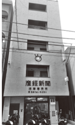
浅草専売所 〒111-0032 台東区浅草4-4-4 TEL:03-3874-5251

町を歩いていて、何人に声をかけられるか。それが、所長が考える「新聞販売所所長の価値」だそうなんです。自分からお客さんにお願ひするだけでなく、お互いに頼みごとをしやすい関係を築いて行けたらきっと上手くいくとの信念を胸に、新しいお馴染みさんが増えだしたこの浅草を「この地域はとも離れられないですね」と愛おしそうに話されていました。