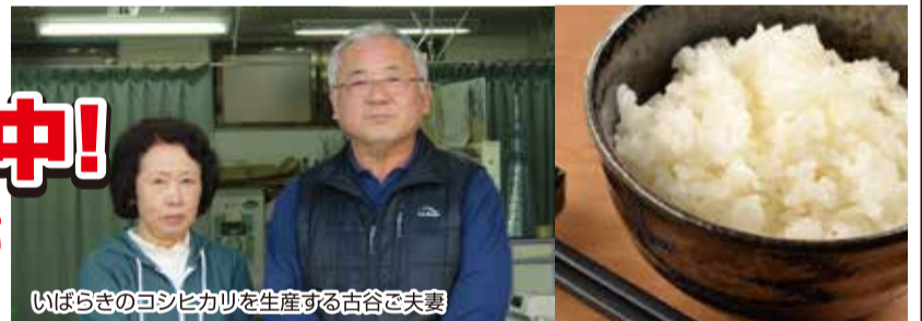
いばらきのコシヒカリを生産する古谷ご夫妻