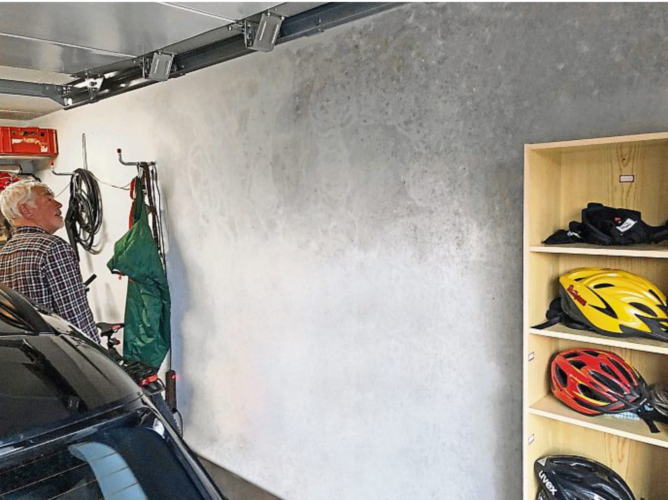
Sichtbare Flecken an den Wänden sind das letzte Warnsignal, um gegen den Schimmel aktiv zu werden.

Den Befall beseitigen und langfristig für eine gesunde Raumluf​t sorgen