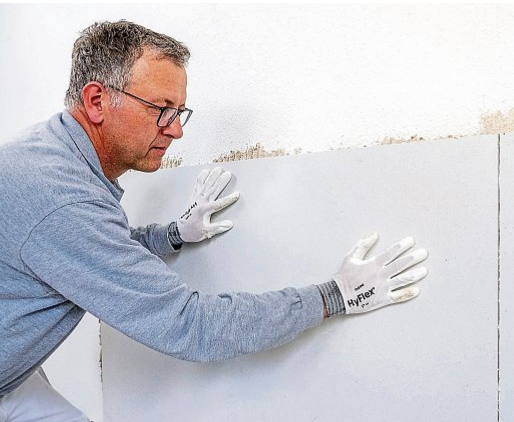
Schimmel dauerhaft beseitigen: Spezielle Innendämmsysteme bieten langfristigen Schutz.

Ist Schimmel erst einmal sichtbar, sollte er keinesfalls einfach überstrichen werden. Denn unter der frischen Farbschicht kann er ungestört weiterwachsen und sogar die Bausubstanz angreifen. Auch Hausmittel wie Essig bringen selten einen dauerhaften Erfolg – sie können den Pilz in alkalischem Umfeld sogar „füttern“. Entscheidend ist es daher, nicht nur die Symptome zu beseitigen, sondern die Ursachen zu verstehen und dauerhaft zu beseitigen: zu hohe Luftfeuchtigkeit, ungedämmte Wände oder unzureichende Wärmespeicherung an der Oberfläche. Hilfreich sind dafür Lösungen, um die Feuchtigkeit effektiver zu regulieren und die Wandtemperatur zu erhöhen. Ein Innendämmsystem für schimmelgefährdete