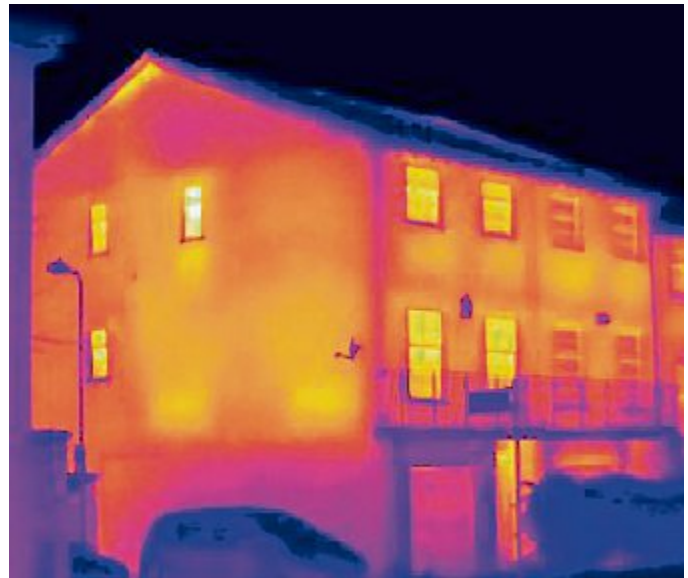
Eine moderne Heizungsanlage kann den Verbrauch um bis zu 25 Prozent senken, eine gute Dämmung sogar um bis zu 35 Prozent.

Wer rechtzeitig plant, kann Investitionen gezielt vorbe-