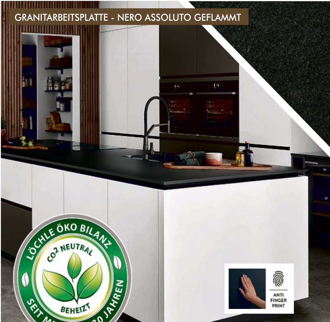
GRANITARBEITSPLATTE - NERO ASSOLUTO GEFLAMMT