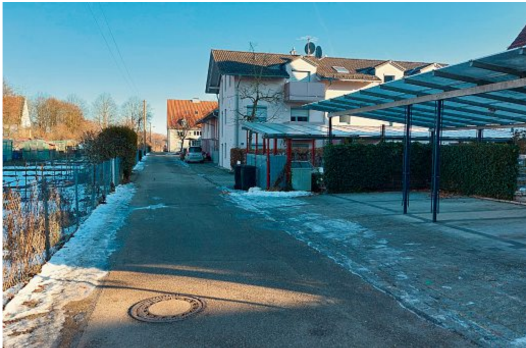
In der Loderergasse wird ab April die Wasser- und Gasleitung sowie die Straße saniert, Telekomleitungen erneuert und eine Fernwärmeleitung gelegt.