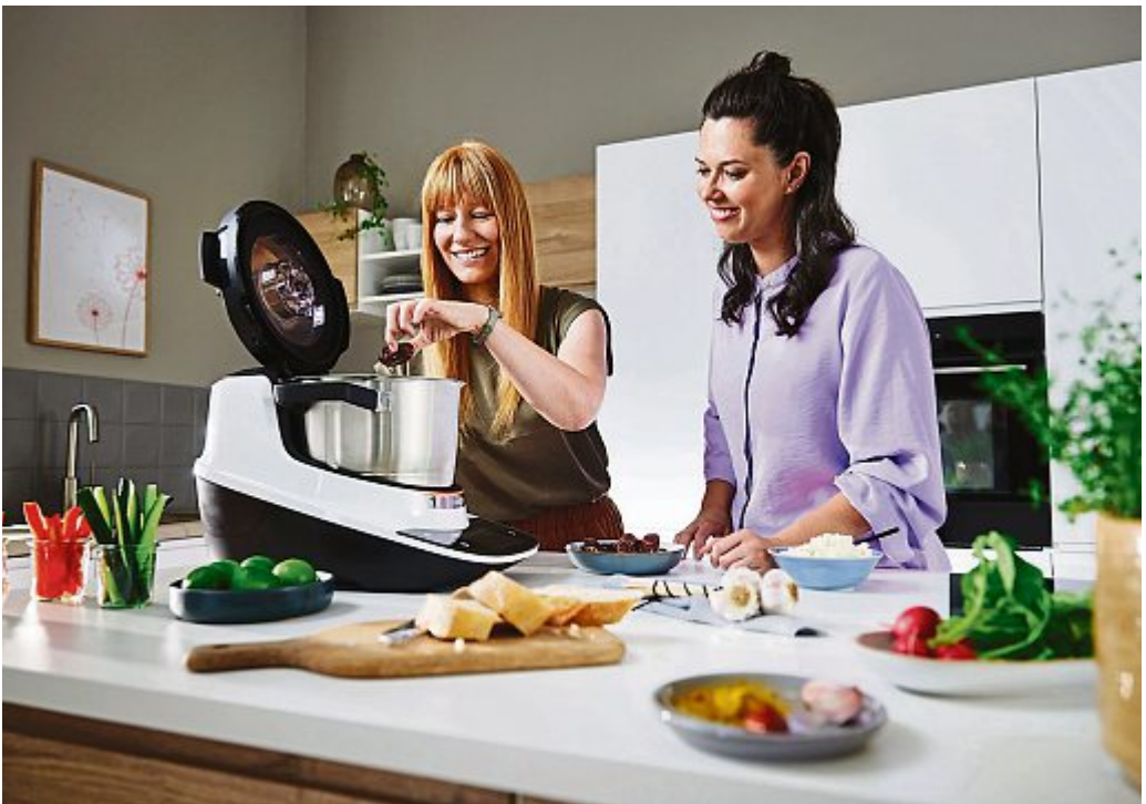
Hobbyköchinnen und -köche lieben moderne, smarte Küchenmaschinen. Entsprechend groß ist die Auswahl – in allen Preisklassen und mit unterschiedlichem Umfang an Funktionen und Zubehör.

Küchenmaschinen sind Kult: Als multifunktionale Helferlein denken sie mit und übernehmen vielfältige Arbeiten im Kochalltag. Hobbyköche und Küchenprofis lieben sie deshalb gleichermaßen. Entsprechend groß ist das Angebot an smarten Geräten – in allen Preisklassen und mit unterschiedlichem Umfang an Funktionen, Rezeptvorschlägen und Zubehör. Kochtopf und Messer sind das Herzstück jeder Küchenmaschine mit Kochfunktion, bei ihnen sind Haltbarkeit, Hygiene und Zuverlässigkeit besonders wichtig.