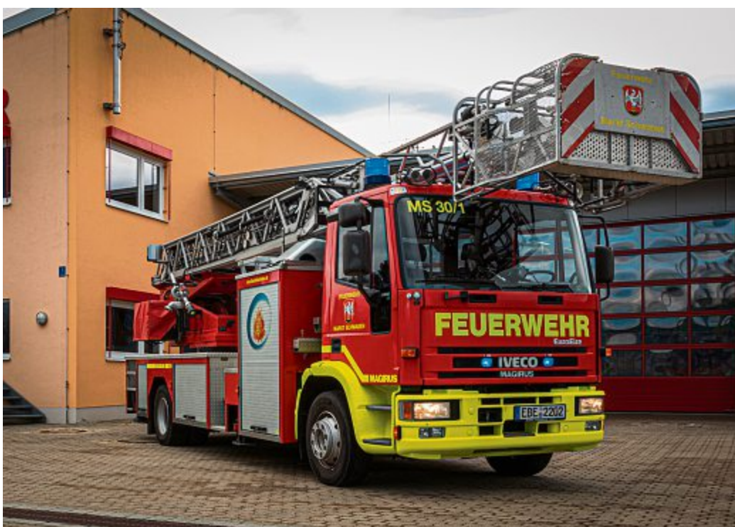
In die Jahre gekommen: Die alte Drehleiter wird deshalb ersetzt.