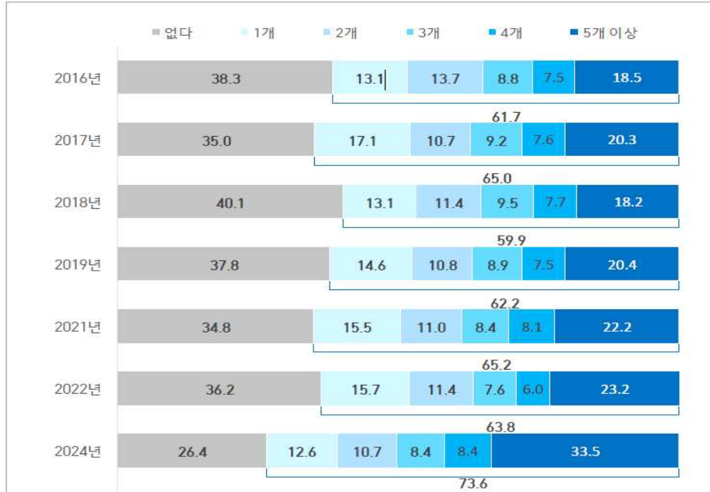
<사진-1> 지난 1년간 경험한 정신건강 문제

B3. 귀하께서는 다음과 같은 일들을 지난 1년간 경험하신 적이 있으십니까?