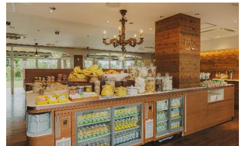
フリードリンク&スナックコーナー

宿泊メニューにフリードリンク&スナックが含まれており、房総半島のラムを使ったカクテルやビール、ソフトドリンク、ウェルカムバナナや落花生を自由にすくえる落花生スcoopなどをご滞在中思う存分お楽しみいただけます。テラスや客室、ロビーやラウンジなどへ持ち込みができます。