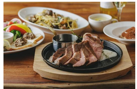
地産食材を贅沢に使った夕食

海と里山に囲まれた南房総ならではの旬の魚介のほか、シカやイノシシ肉を活用した名産・館山ジビエ、地元野菜を使い前菜からメインディッシュまで、旅にふさわしい一皿をご提供します。