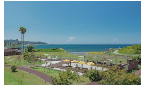
海へと続く広大なテラス

今回のリニューアルでは、海に向かうテラスを大きく拡張しました。ウッドデッキや芝生、砂場、リゾートチェア、ファイヤーピット、光るバナナモニュメントを配置するなどお客さまが自由な過ごし方ができるエリアを新設しました。館山の夕日を眺めながらゆったりとお過ごしいただけます。