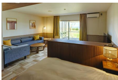
シーサイドテラスルーム・プレミア

海沿いのテラスに面した「シーサイドテラスルーム・プレミア」、愛犬と共に泊まれる「ドッグフレンドリールーム」、客室のスペースにゆとりをもった「ユニバーサルルーム」など、観光やビジネスシーンにもご利用いただける仕様となっています。