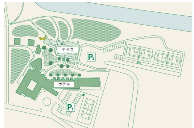
「TAUTAU Terrace Tateyama」エリアマップ

【アクセス】JR 館山駅より車で約 15 分 東京駅八重洲口よりホテルまで直通の 高速バスで約 2 時間