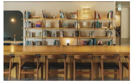
「JRE Local Hub 館山」コワーキングスペース

館内にはコワーキングスペースと一棟貸しレンタルオフィスも完備しています。ワーケーションの拠点として利用でき、館山エリア内外のコミュニティをつなぐ場所として、居住エリアに捉われない働き方を後押しします。