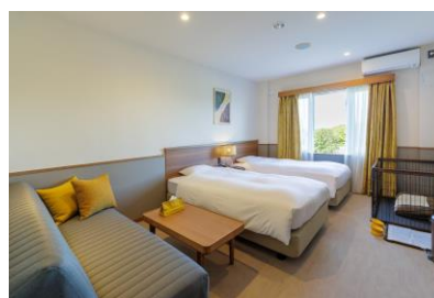
ドッグフレンドリールーム