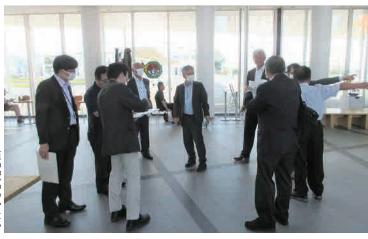
道の駅わっかない

稚内市では、市街地の中心に稚内駅をはじめ、フェリーターミナル、バスターミナルなど主要交通網が集中し、市役所や金融機関、市立病院が整ったエリアとして道北地方の地域経済を牽引し発展してきたが、人口減少や災害の影響等もあり、稚内駅周辺の中心市街地の衰退が課題となっていた。今回、『道の駅わっかない(中心市街地活性化基本計画)』のほか、『観光振興ビジョン』、『中小企業振興基本条例』について視察したが、これらが地域経済の活性化に結び付けようとする施策として関連性をもって複合的に進められていると感じた。併せて、国や道とも緊密に連携して事業を推進しており、また、行政とともに市民、中小企業、観光事業者が一体となって地域経済の立て直しに尽力している様子が見られた。施策を複合させて取り組むこと、各種団体との連携により取り組むことの重要性を再認識することができた。