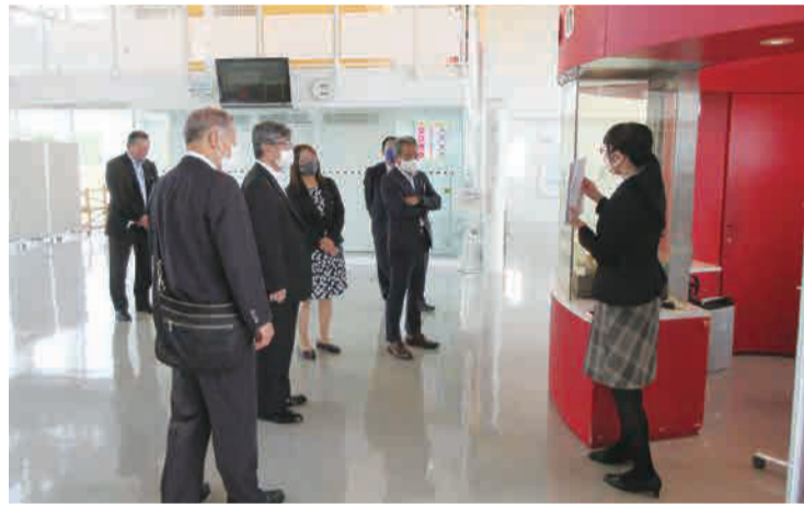
千歳市防災学習センター『そなえる』

千歳市には、大規模な自衛隊関連施設があることから、住民に自衛隊関係者が多く、様々な協力体制が取れることや潜在的に防災意識が高いことも想定される。自衛隊との連携は、退職後の自衛官が総務部危機管理課の参事として任用されており、有事の際、自衛隊の派遣要請に迅速に対応できる体制となっている。本市でも陸上自衛隊と防災担当者が平時から定期的に情報交換を行っており、円滑な活動着手が可能と思われる。幼稚園児・保育園児、小中学生の段階からの防災意識の醸成は重要で、防災学習交流施設の存在は非常に有意義なものと考えられる。千歳市の構想と同様に「災害対応能力の高い組織、人づくり」、「防災関係機関等との連携強化」を目指し、本市としてもさらなる「人づくり」を推進することが重要である。