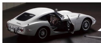
▲トヨタ2000GT 全巻セット

▲オリジナルアクリルキーホルダー デアゴスティーニのアーカイブシリーズ 創刊号の表紙デザイン （表：表紙／裏：ロゴ）