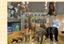
B：群馬の自然と環境