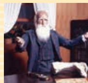
C：ダーウィンの部屋