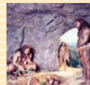
D：自然界におけるヒト