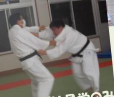
柔道部は見学のみ