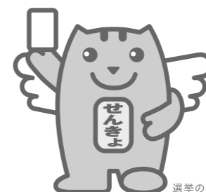
選挙のめいすくん