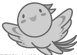
兵庫県マスコットはばタン