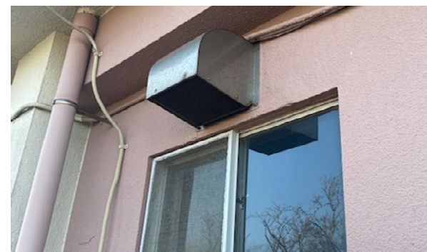
SUS製ウエザーカバー