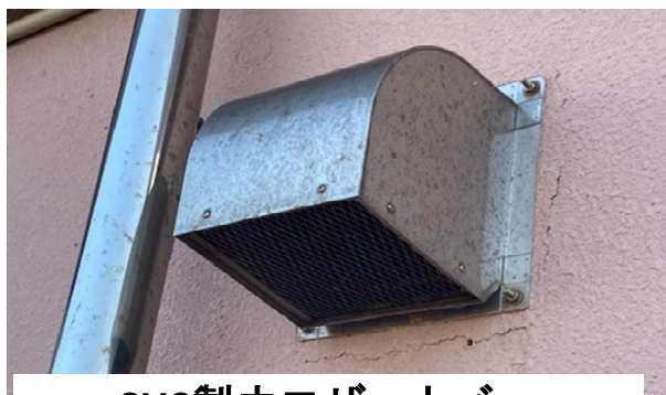
SUS製ウエザーカバー