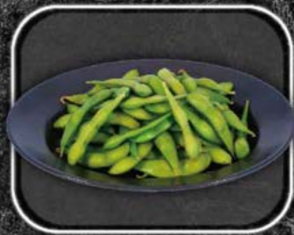
G reen soybeans 400yen 枝豆