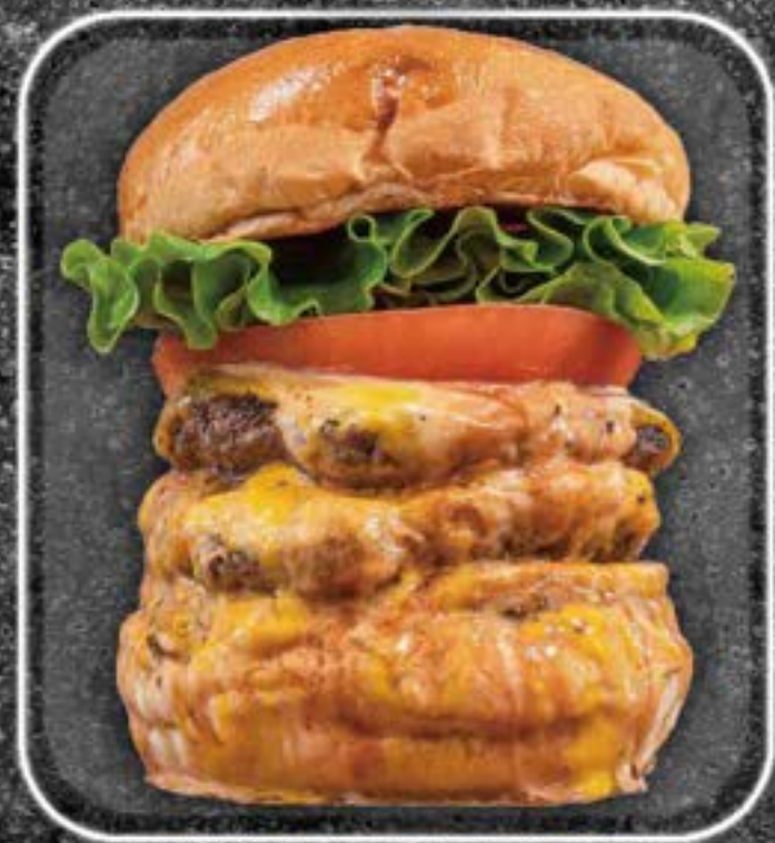
Triple 1800yen cheeseburger

パティー2枚 / チーズ2枚 / トマト / レタス / ピクルス / BBQ ソース / オーロラソース / マスタード