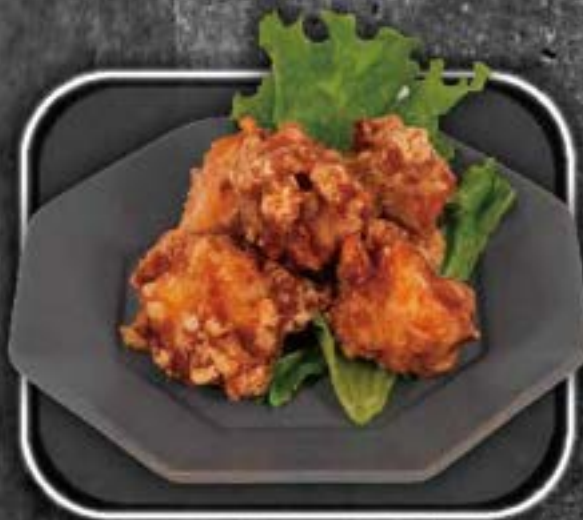
F ried chicken 500yen 唐揚げ