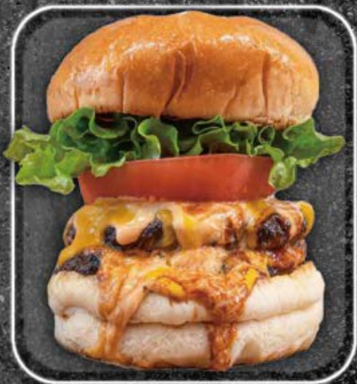
Double 1300yen Cheeseburger