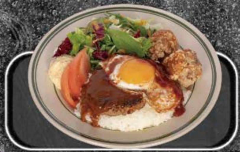
Loco moco Plate