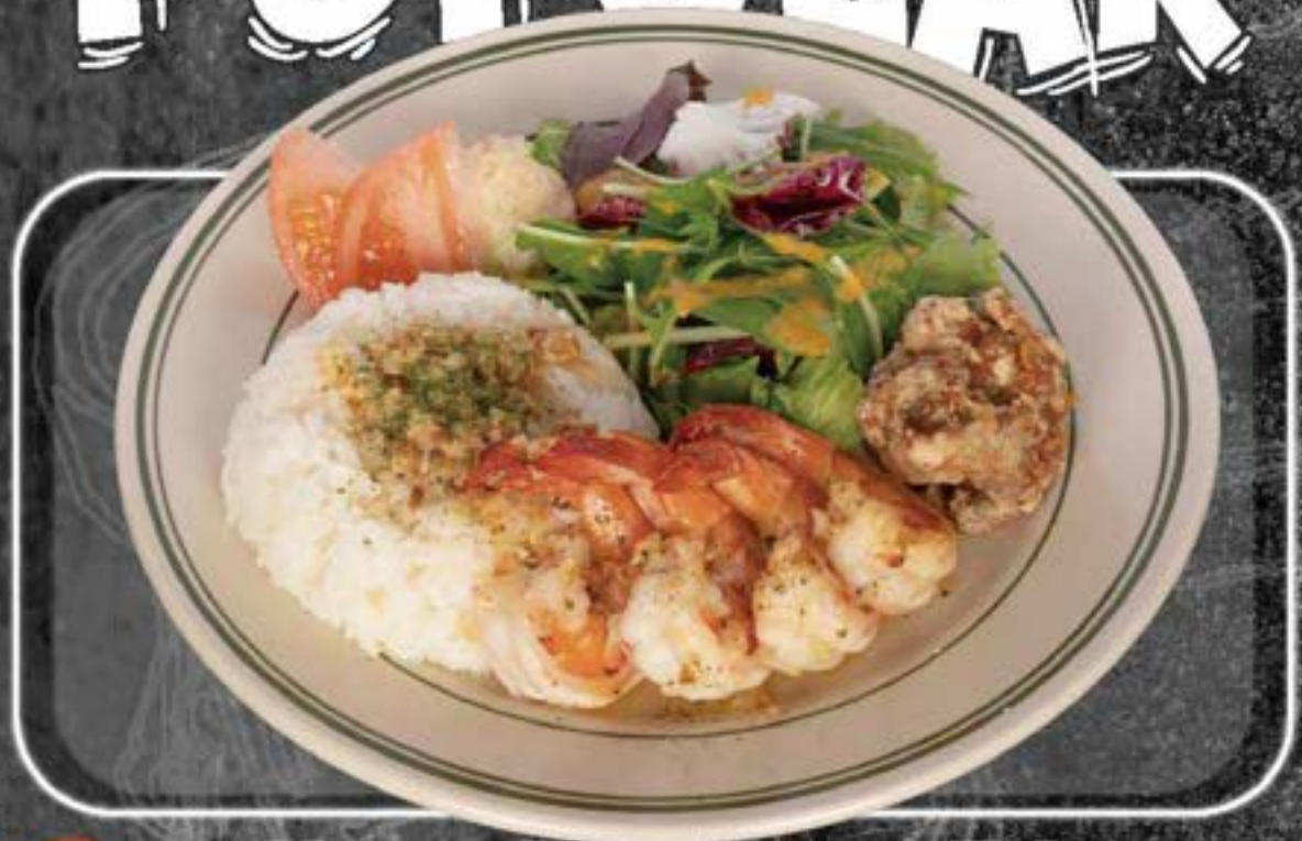
Garlic shrimp Plate