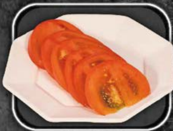
T omato slice 400yen トマトスライス