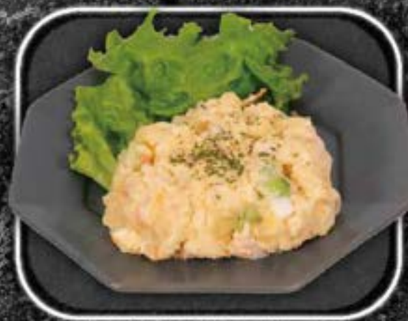
C ream cheese potato salad 550yen クリームチーズのポテサラ