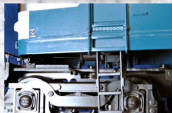
隠れたディテールの再現もオプションで簡単に可能