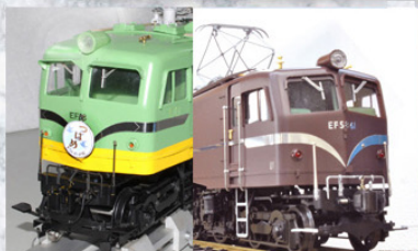
オプションB・C一部装着例