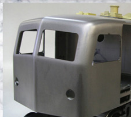
未塗装キットは鉄ボディを防錆メッキ処理済