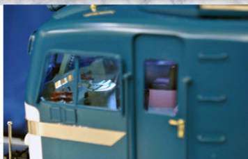
A運転席セットを装着した作品例