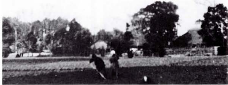
●解放の対象となった農地(22年 上鷲宮)

戦時下では、強力に軍需産業を押し進めるために無制限に公債を増発して政府資金をばらまき、戦後は復興と救済のために膨大な資金を放出したため、通貨の増大と物資不足が相まって空前のインフレを招いた。闇の横行がこれに拍車をかけたから、一日ごとに物価が上昇し、生活は窮地に追い込まれた。公共料金なども年に2度も3度も値上がりし、たとえば、22年2月に都電は40銭であったが、2月と4月と9月に値上げ