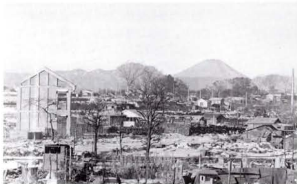
●富士山が大きく見える。高根町の高台より谷戸小学校方面を見る（20年冬）

精も根も尽き果てた後の終戦であった。家を焼かれ、家族を失い、あるいはバラバラのまま、とにかく長く苦しかった戦争は終わったのである。区内は家屋も人口も約半分に、見渡す限りの焼野原であった。