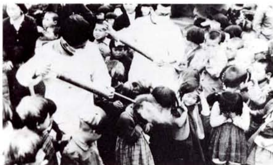
●子どもの頭にDDT散布(21年)

文部省は新しい教育方針を打ち出し、20年9月14日「新日本建設ノ教育方針」を発表したが、この根本精神は国体護持であった。そして授業再開に先立ち、教科書の戦争関連記事の部分を削除するいわゆる「スミぬり」を通達。「あまりにスミの部分が多くて意味がわからない」「今までいちばん大切だとされていた部分を今度は消せと、何もかもわからなくなった」という子どもたちもいた。10月10日の「学校勤労勤員令廃止」を最後に戦時教育体制は終わった。22年4月1日から「教育基本法」「学校教育法」が施行され、「6・3制」などの新教育体制へと移行した。