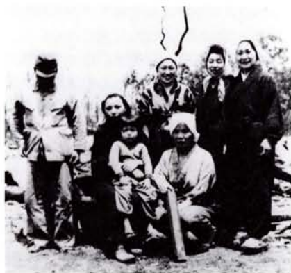
●焼跡で(20年5月 神明町にて)