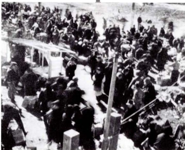
●(上)各家庭に配布された「生活用品公定価格表」の表紙(24年) (下)中野駅北口の闇市(21年頃)