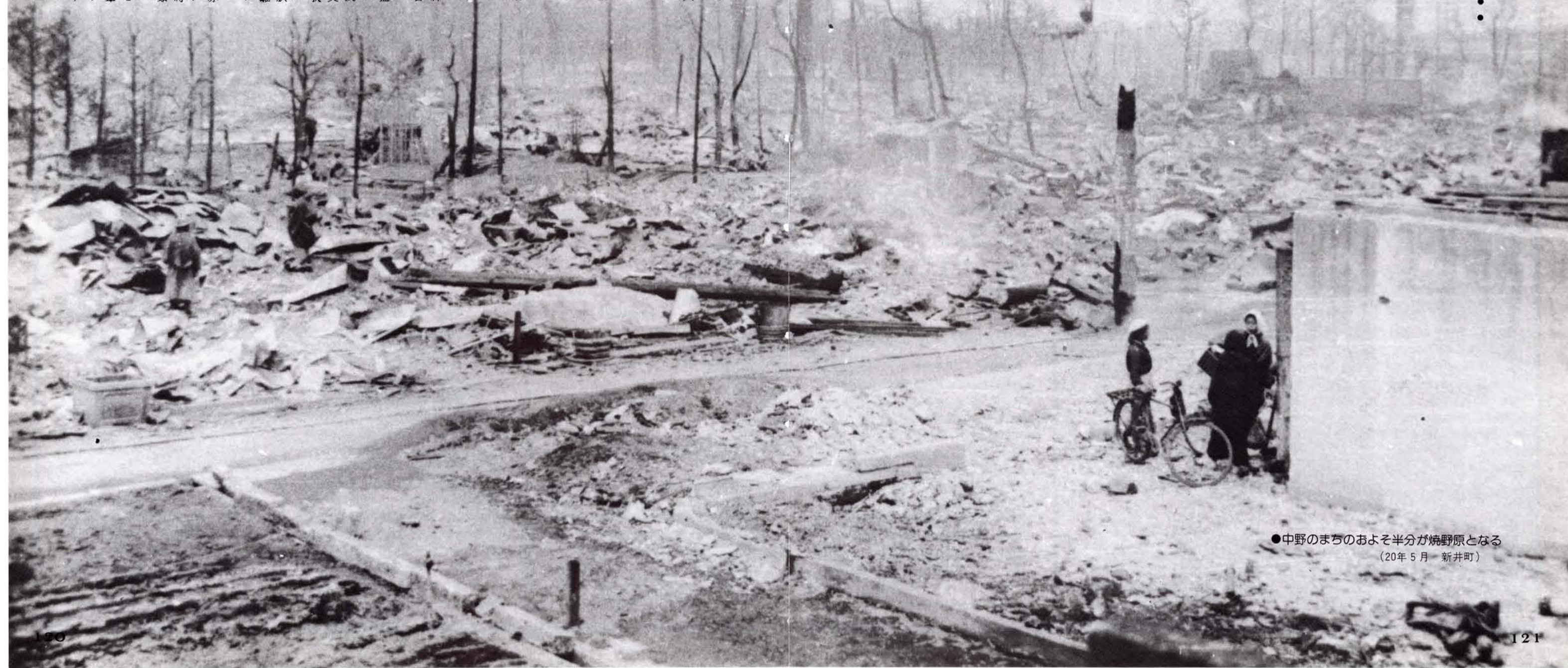
●中野のまちのおよそ半分が焼野原となる (20年5月 新井町)