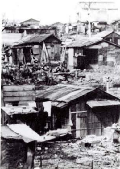
●(左)焼けた木やトタンで作ったパラッ フ(20年頃 新井町) (上)パラッフが軒を並べて