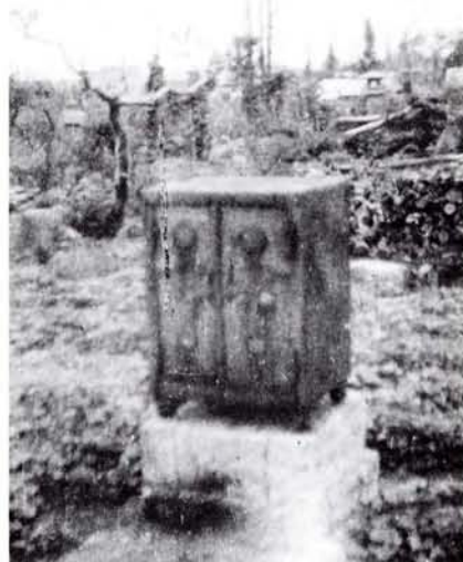
●焼跡の金庫(20年5月)