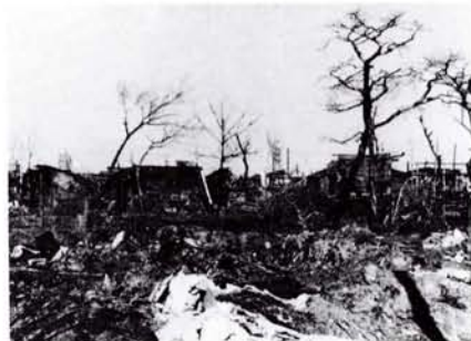
●新井薬師附近(20年)