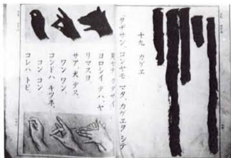
●(上)スミぬり教科書 (右)運動会では、カぼちゃなどの野菜が景品に(22年 谷戸小学校)〈矢島氏提供〉 (下)バラック校舎で授業を再開した(22年)