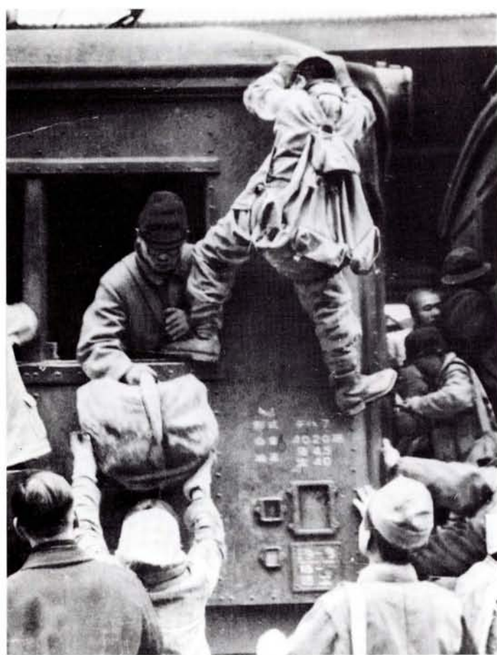
●買い出しはまず電車に乗るのがひと苦勞 (21年)