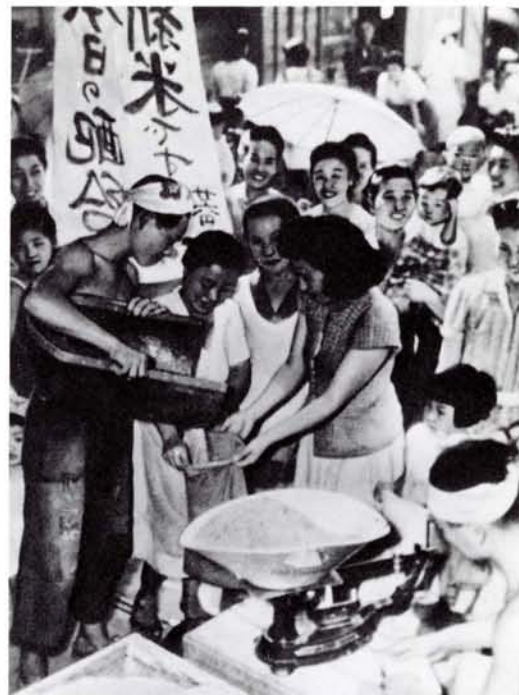
●(左)いもは米の代替物、いも10kgで米2升がさし引 かれた(21年)〈毎日新聞社提供〉 (上)久しぶりの米の配給に笑顔が…(21年) 〈毎日新聞社提供〉