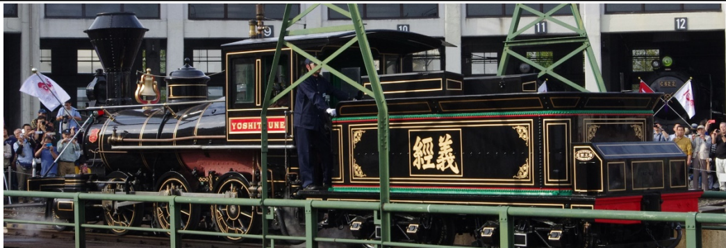
弁慶の性能は、このリンク先で確認してください： https://youtu.be/GENQ-Ntyk10