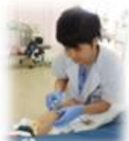
救急外来にて処置