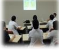
レジデントレクチャー