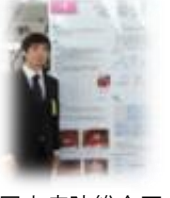
国立病院総合医 学会での発表