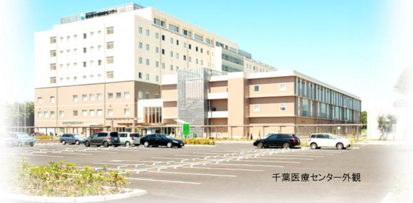
千葉医療センター外観

当院のプログラムは3年間の専門研修期間中に、サブスペシャリティの研修に比重を置く期間を設けるサブスペシャリティ重点研修タイプです。 3年後の専門医取得のみならず、その先のサブスペシャリティ専門医資格の取得も目指します。