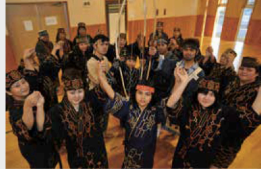
帯広カムイトウウポポ保存会