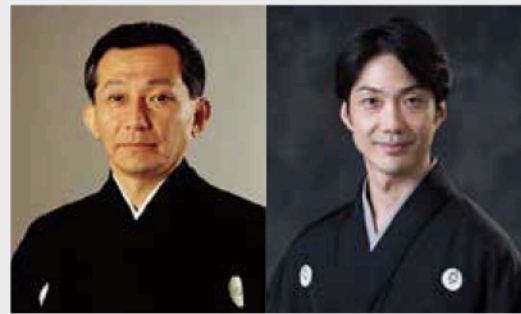
観世 清河寿 かんぜ きよかず