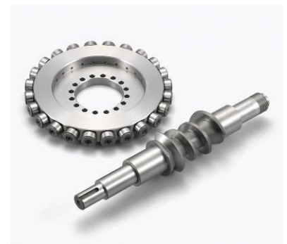
減速機タイプローラーギヤ