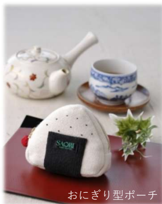
おにぎり型ポーチ

手織り機を使い、ひと織りひと織り丁寧に手作りした「世界に一つだけ」のコースターなどを販売します。他にも思わず「かわいい」と言ってしまうユニークなデザインの小物入れや、バック、ポーチ等を作っています。