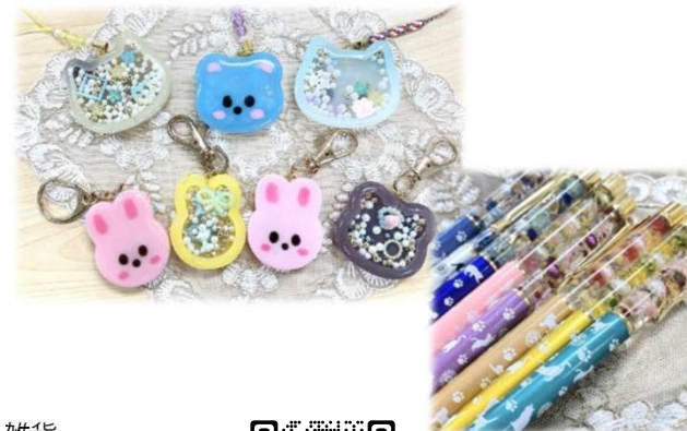
ハーバリウムボールペン

利用者さんの訓練の一環として、動物や自然をテーマにしたアクセサリー・雑貨の制作をしています。売り上げの一部は動物保護団体に寄付しています。