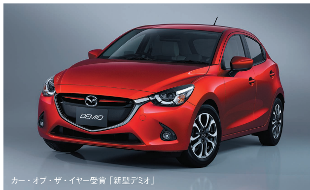
カー・オブ・ザ・イヤー受賞「新型デミオ」

受賞理由として、『国産コンパクトカーの常識を打ち破るデザインとクオリティ、そしてテクノロジーをリーズナブルな価格で実現したこと。低燃費技術を追求するなかで、新しい選択肢として小型クリーンディーゼルを採用する一方、MTモデルをリリースするなど多彩なニーズに配慮している点も好印象で、軽快なフットワークと相まってクルマの楽しさを再認識させてくれた。独自の魅力にあふれ、日本から世界に向けてアピールできる実力を持ったコンパクトカーである。』と、光栄なコメントをいただきました。(マツダ株式会社 東京総務室)