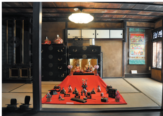
ひな人形(太田家所蔵)

は、煩わしいようですが・・・② 古い町並み がそのまま残っているのも都会の人達は、何かホットされるようです。③2月末から3月中旬にかけて町中にお雛様を飾る『 町並み雛祭り 』があります。昔栄えた港町なので、立派なお雛様がたくさんありそれが