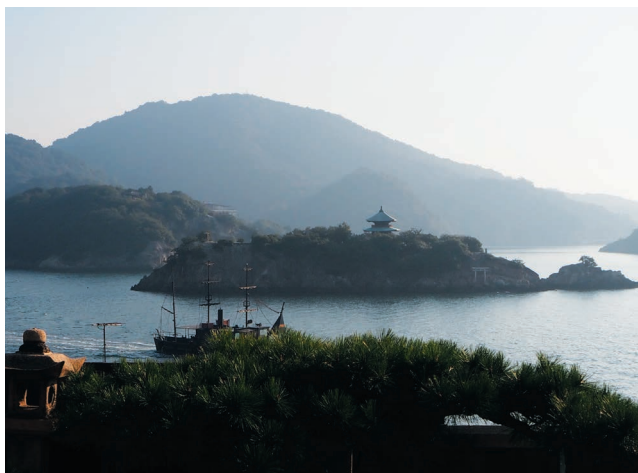
対潮楼「日東第一景勝」(福禅寺)

業をしながらでしたので、子供を持つ親の気持ちはわかります。参観日等の学校行事や子供の急な病気にも毎日の朝礼で臨機応変に業務をシフトしています。女性が多い職場のため女性目線だから出来ることも知れません。商品開発等いろいろな所にも主婦の目線は大切です。デメリットと言えば「女性社長ですか？」と聞かれる時には抵抗を感じますが、この頃は慣れて「何が悪いの？」と思います。(笑)「女性の地位が低い事だからと思っておりましたが、これは自分の仕事に対する姿勢が甘かったからだ」と今は思っています。