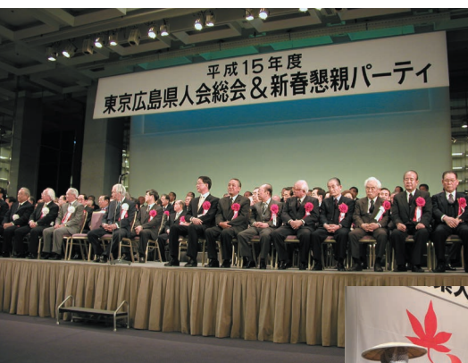
平成15年度 総会風景

パーティーと会議の部屋を分けてね。その時お金がないので考えついたのが、会費。一般会員が年会費3,000円、役員が