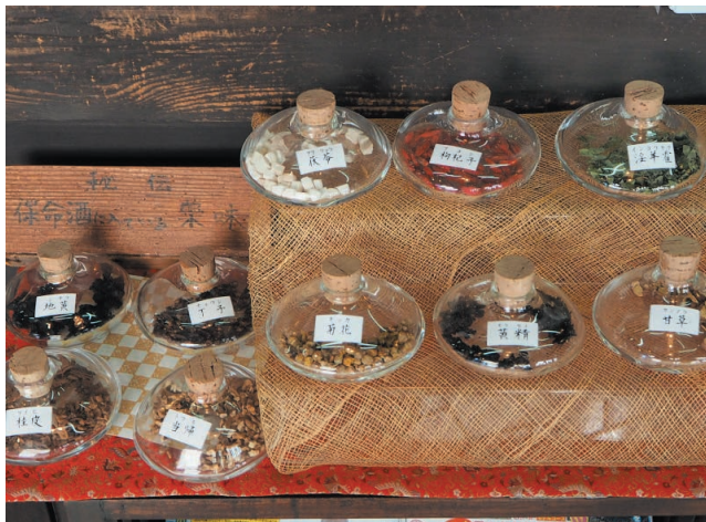
保命酒に入っている薬味

「保命酒のど飴」は、主人(先代社長)のアイデアです。ヘビースモーカーだったのですが、体のためにタバコをやめ、口が寂しく飴ばかり舐めていました。それで「うちで保命酒の入った飴を作れないか？」と思い立ったようです。又わが社は、味醂(ミリン)の醸造元でもあり、いつも味醂を買って下さるお客様へのプレゼントをわが社らしい物と考