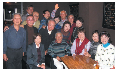
神楽坂・結華楼にてのテニス部大忘年会