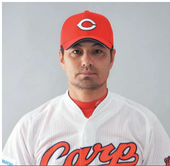
広島東洋カープ監督 緒方孝市

2015年のスタートにあたり、「新しい挑戦が始まる！」清々しい、そしてわくわくする胸の高鳴りを感じています。