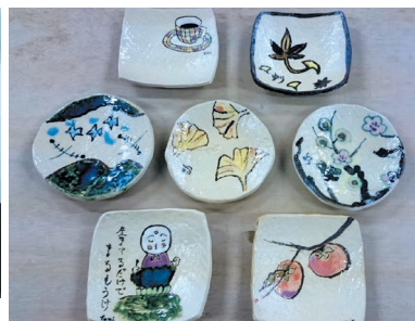
作陶風景と出来上がった作品