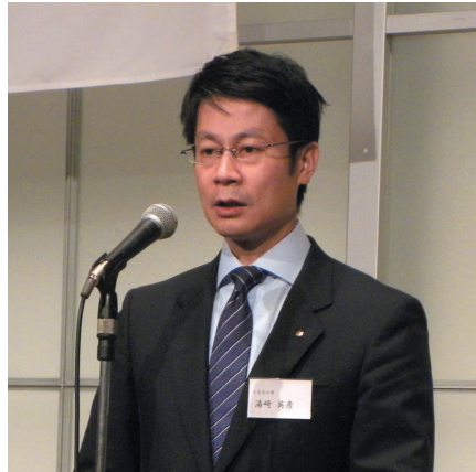
湯崎英彦広島県知事