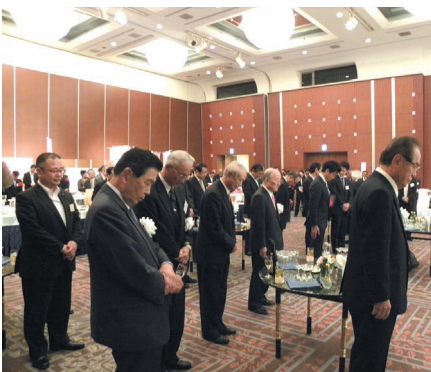
土砂災害の犠牲者の方々に黙祷