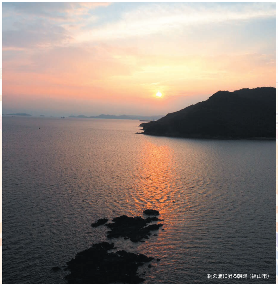
鞆の浦に昇る朝陽（福山市）