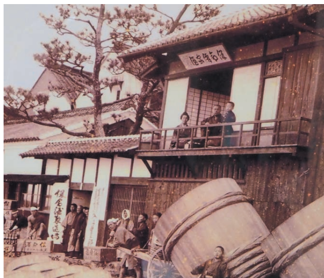
江戸時代の入江豊三郎本店風景

「座右の銘」とは、おこがましいですが常に私の 心の中にあることが2つあります。1つは『 艱難 (カンナン)、汝を玉にす 』という言葉です。苦勞は、 人間を磨きます。苦しい事があると自分で気分を 切り替えて行くようにしています。例えば、「この 出来事から学ぶ事は、なんだろう？」とか、「自分 はまだ修行が足りないのかな？」と思いながら やっております。2つ目は『 温故知新 』という論語 の言葉です。古い物を大事にし、新しい物にも挑戦 していく事と自分流に理解しております。これは先 程の「企業理念」にも繋がることだといつも肝に銘 じています。