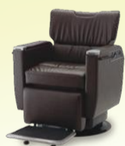
BRAMU ブラム 月々11,400円~