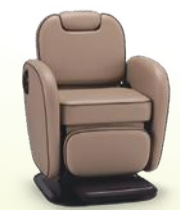
macaron マカロン 月々8,200円~