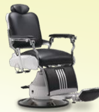
Classica 90E クラシカ 90E 月々8,900円~