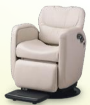
LUAR ルアー 月々10,800円~