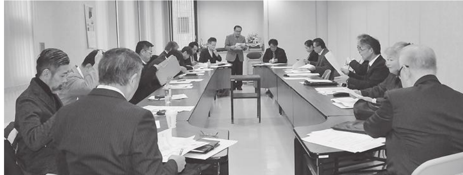
〇会議出席理事の皆様

令和元年11月18日(月)盛岡桑田会館2階会議室において、第2回理事会を開催。冒頭公財法人いきいき岩手支援財団より結婚サポート制度の説明があり、理容組合でも支援をし、社会的存在や社会的貢献アピールが出来る事から協定が了承された。