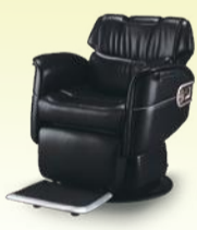
MARVEL マーベル 月々13,600円~