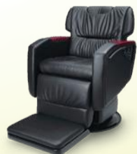
Divan ディヴァン 月々14,100円~

POINT 1 初期投資額を抑えられる! 毎月一定の料金のお支払いなので、初期投資額を抑えることが出来ます。