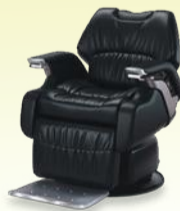
LEGEND II レジェンドII 月々10,600円~