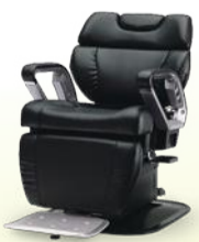
INOVA-EX イノヴァEX 月々8,200円~