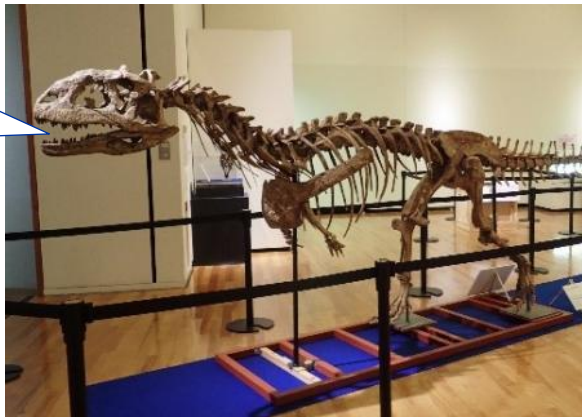
マジュンガサウルス