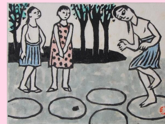
けんけんたび(『大正走馬灯』より)

昔は表通りに面していない路地裏で遊ぶ子どもの姿をよく見かけました。道路に口ウ石と呼ばれる柔らかい石で丸を書き、その中に石を投げ、片足で跳びながら前へ進みます。最後まで進んだら折り返し、石を拾って戻る遊びです。石が入っている丸は踏むことができないため、片足で跳んだり、しゃがんだりするのが難しかったそうです。