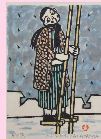
竹馬(『大正走馬灯』より)

二本の竹に足掛けとなる横木を付けたもので、横木に足を乗せて、バランスをとりながら前へ進みます。上手になると、横木の位置を上にずらして高くしたり、片足歩きをしたり、塀の上から乗ってみたりと、色んなことに挑戦したようです。今のようにはテレビゲームなどが無い時代は、子どもは多くの時間、外で遊び、おもちゃも木や竹などで手作りしたものが多くみられました。