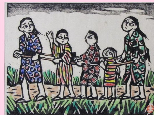
きしゃぼっぽ(『大正走馬灯』より)

長いロープを輪にして、その中に数人が列を作ります。一番前の人(運転手)が、一番後ろの人が車掌の役で、間の人(お客様)の役をします。この作品では、大きなお姉ちゃんたちが運転手や車掌の役をして、年下の子どもたちがお客様の役をしています。年齢に関係なく、一緒に遊ぶことができます。