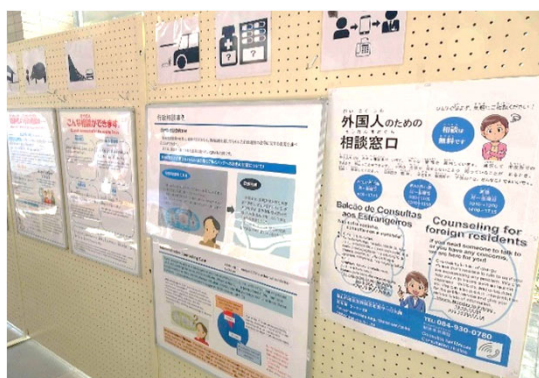
行政相談パネル展で、外国人にも分かりやすいピクトグラムを活用（広島県福山市）