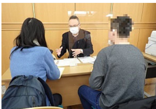
市が主催する外国人居住者向け相談会に参加し、行政相談を受付（大阪府東大阪市）