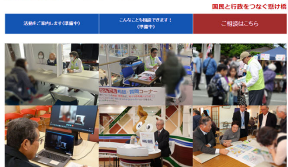
行政相談委員とは？ 総務省が委嘱した民間有識者で、全国35,000人(各市区町村10人以上)が配置されています。地域における住民の厚いつながり、素朴なボランティアとして、国民の暮らしから、国の行政活動全般に関する苦情や相談を受け付け、相談者への助言や関係機関での改善の申し入れなどを行っています。