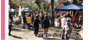
三島フードフェスティバル