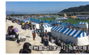
甲州富士川まつり(令和元年)

11/12 身延線 鯉沢口駅スタート 甲州富士川まつりを巡り 秋の富士川町を満喫!