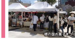
穂の国お菓子まつり

9/17 東海道線・豊橋駅スタート 東三河の「お菓子」大集合、 穂の国お菓子詣で 「お菓子の神様」を訪ねて