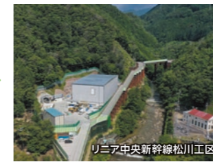
リニア中央新幹線松川工区

9/24 飯田線 切石駅スタート 飯田駅開業100周年記念 今、見ておきたい松川の風景と 名水100選「猿庫の泉」を訪ねて