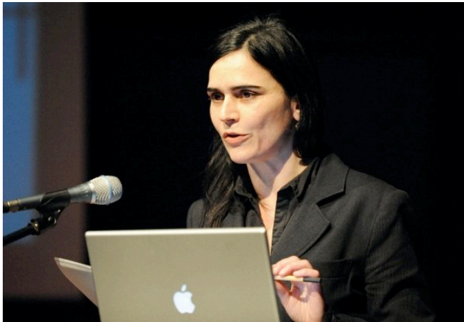
„talks in-between emergencies“, ZKM Karlsruhe

Anschrift: Ackerstr. 14/15 10115 Berlin Deutschland