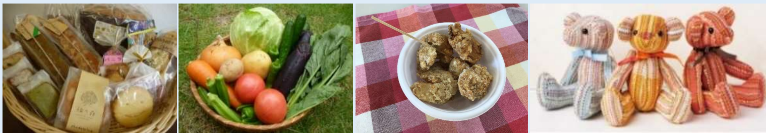
※写真は授産商品の一例です