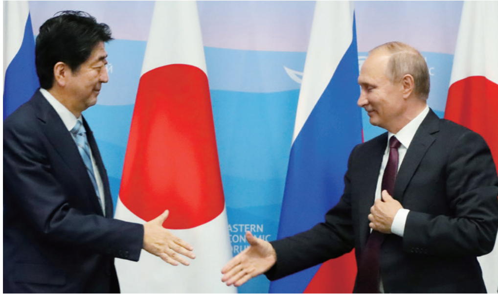
ロシア・プーチン大統領