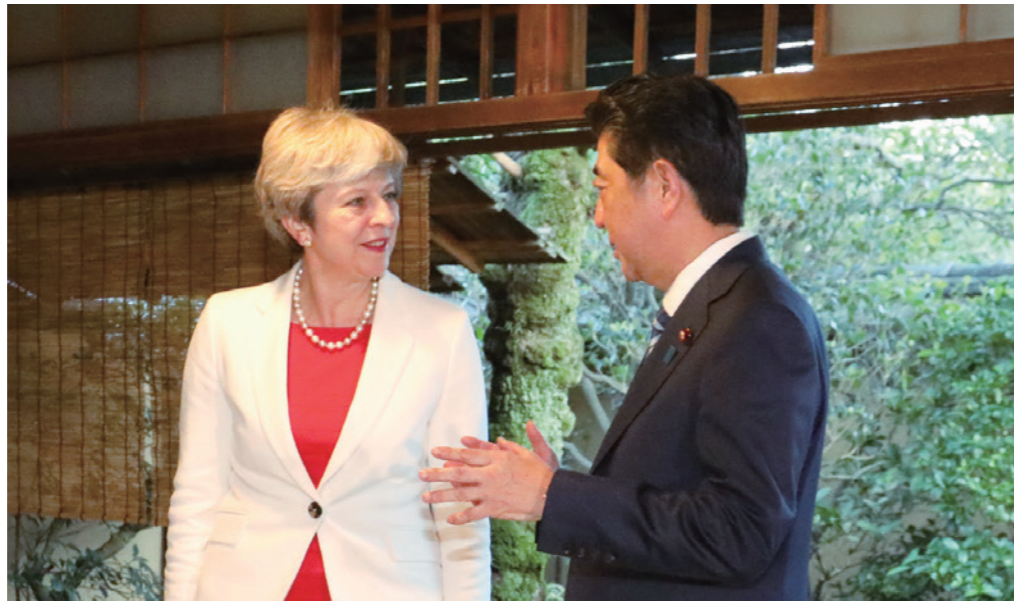
イギリス・メイ首相