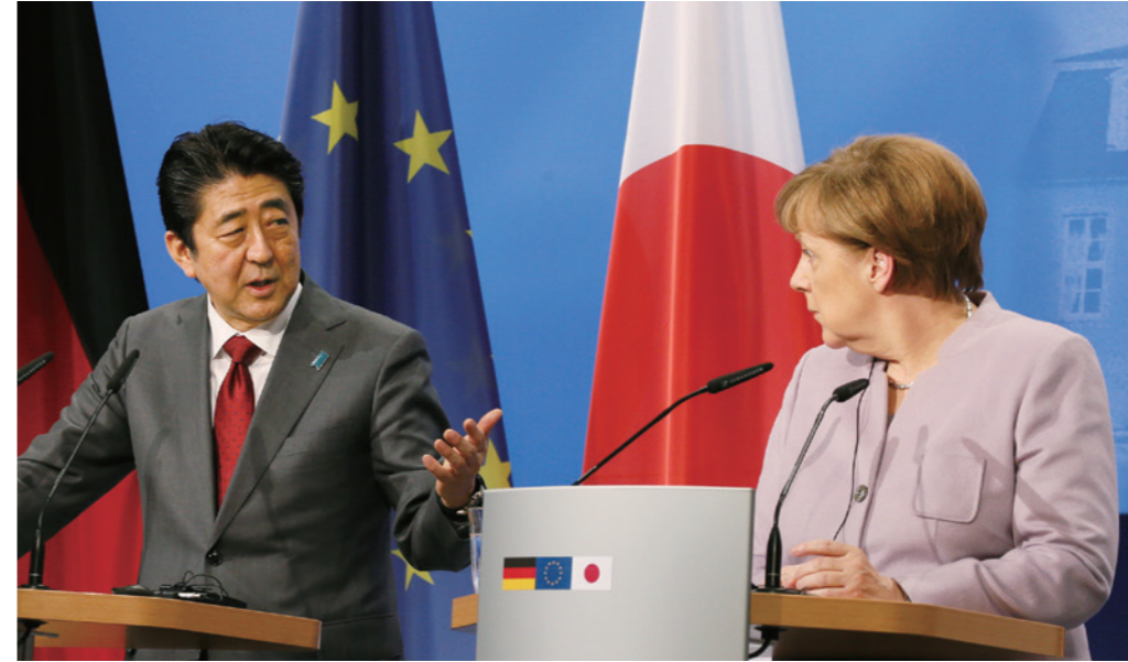
ドイツ・メルケル首相