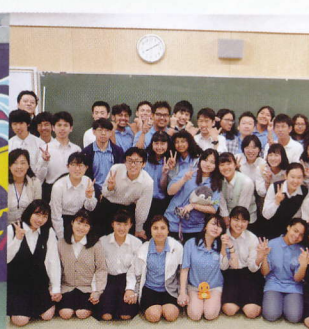
姉妹校 E・ルーズベルト校来校 (今年度は中止)