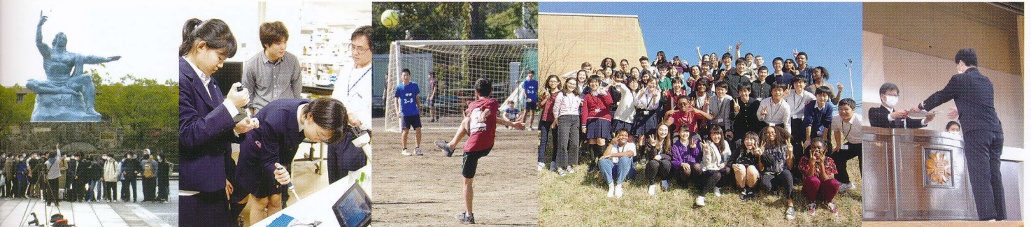
修学旅行 (10月) 校外研修 (10月) 球技大会 秋 (11月) 姉妹校訪問 (3月) 卒業式 (3月)