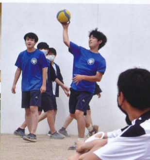
球技大会 夏 (5月)