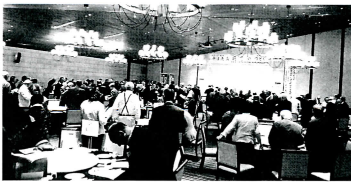
平成26年度 同窓のつどい

中津市及び近郊の在住者の減少、若年層の「同窓のつどい」への不参加、役員・理事にしか求めているなか、同窓会費の納入減少、等がこれによって解決するのではと考えました。また、「同窓のつどい」の参加者に同窓会費(一口3,000円)の納入も呼びかけることができました。