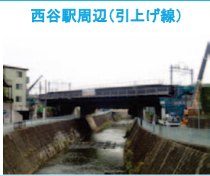
西谷駅周辺(引上げ線)