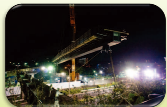
羽沢駅（仮称）：羽沢歩道橋架設