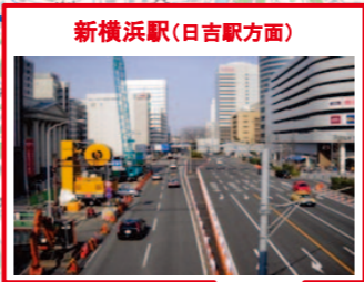
新横浜駅(日吉駅方面)