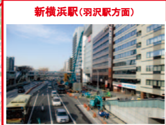
新横浜駅(羽沢駅方面)