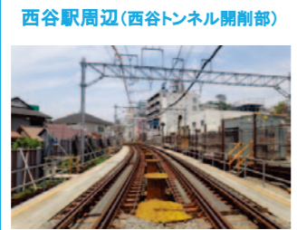
西谷駅周辺(西谷トンネル開削部)