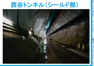
西谷トンネル(シールド部)