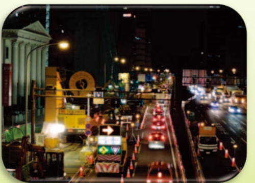
新横浜駅（仮称）：鋼製連続地中壁工