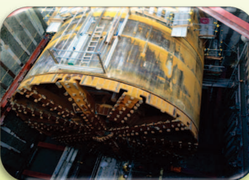
西谷トンネル：シールドマシン立坑到達