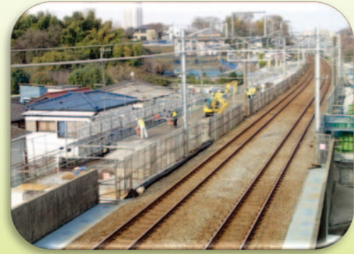
西谷駅付近（引上げ線）：路盤工