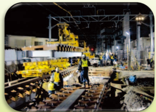
西谷駅付近（開削工事）：工事桁設置