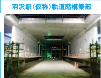
羽沢駅(仮称)軌道階構築部