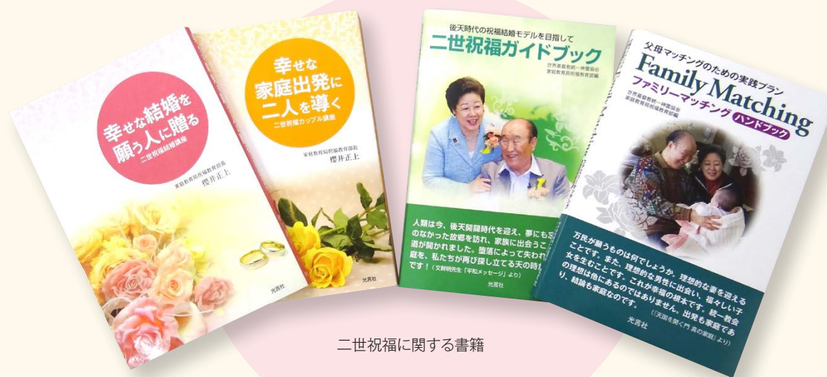
二世祝福に関する書籍