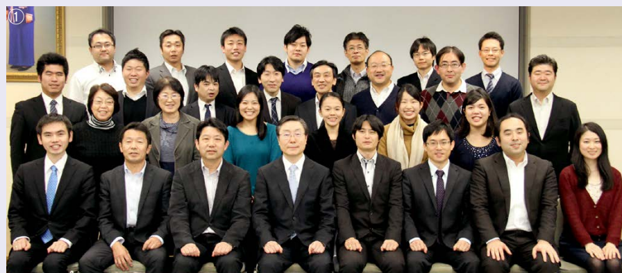
2014年度地区代表成和学生部長研修会

日時：天一年2年 天曆年10月19日～20日（陽曆：2014年12月10日～11日）主催：青年学生局 成和学生部 場所：一心特別教育院