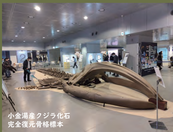
小金湯産クジラ化石 完全復元骨格標本

博物館活動センターでは、自然史に関する調査研究や、札幌の自然に親んでもらうための活動を行っています。