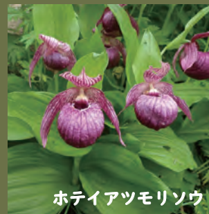
ホテアツモリソウ