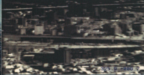
サーマルカメラ(昼間)