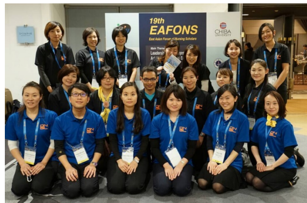
大学院時代 5大学の学生と国際学会で