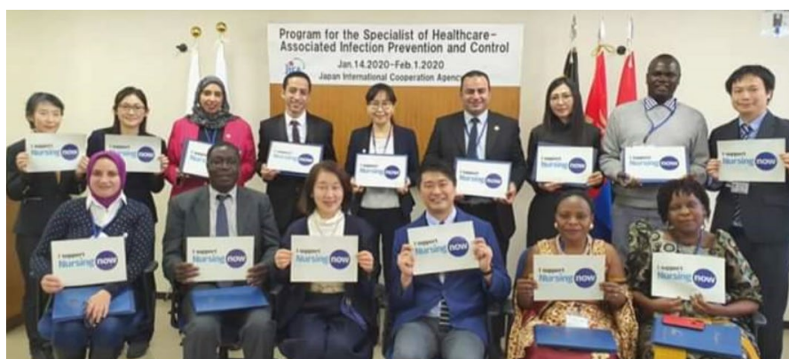
2019年度医療関連感染管理指導者養成研修閉校式で “Nursing Now”キャンペーンに参加