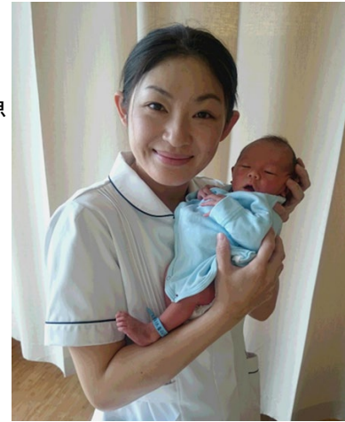
臨床での助産師時代

2015年4月に兵庫県立大学大学院の5年一貫博士課程の災害看護グローバルリーダー養成プログラム(DNGL)に入学しました。大学院では、常に「実践力と研究力をそなえた看護職者」を目指し勉強しました。国内外での学会や国際会議等での発表を積極的に行い、災害関連では、研修などに参加し、災害看護専門看護師とNPO法人Both-AIを立ち上げ、防災減災のために活動していました。また、東日本大震災、西日本豪雨などの被災地支援をし、被災地での活動には、常に「人々の真のニーズに添い自立を促し、生きる力をそと支え、よりよい人生や生活につなぐ」という視点を持つことが不可欠であると考えようになりました。