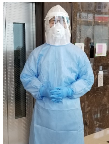
新型コロナウイルス感染症 関連の検疫所支援業務の様子