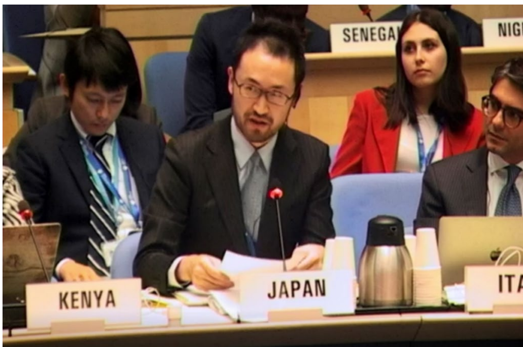
WHO理事会で発言の準備と読み上げを担当

留学後は公衆衛生大学院で精神保健学の助教をしたり、研究所に所属する中で、フィリピンの薬物依存に関するプロジェクトに日本から参加する機会やWHOのガイドライン評価委員会の外部委員を務める機会に恵まれました。一方で、国際保健に軸足を移すには年齢的にも最後のチャンスかもしれないと思い、短期専門家を経験後に協力局の医師募集に応募しました。