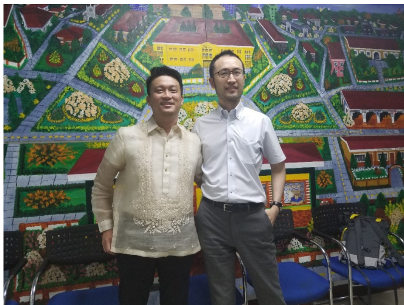
学生時代にIFMSAと一緒に活動し、その後も家族ぐるみのお付き合いをしているフィリピン保健省の医師と短期派遣中偶然同じフロアで働くことができました！

一方で、行政の中にも自治体や国の政策がどのように決められているのか、あるいは決められるべきなのか、ということへの疑問はむしろ膨らんでいきました。