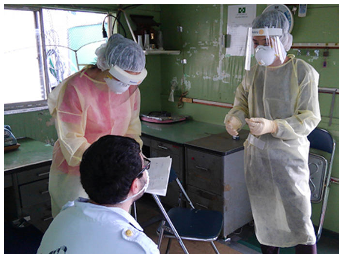
長崎クルーズ船支援時の患者診察

入局後は、COVID-19のパンデミックの影響もあり、なかなか海外渡航自体が難しくなってしまったことは残念ですが、それでも自身の感染症医としてのバックグラウンドが活かせる現場（武漢チャーター便の帰国者の対応や、複数のクルーズ船対応、複数の軽症者療養施設の立ち上げや運営への参加等）に多く派遣していただき、診療業務や感染管理、関連の研究にも携わることができたので非常に貴重な経験を積み重ねることができています。いずれの現場でも印象的であったのは、多様なバックグラウンドの方たちが、未曾有の事態にも関わらずお互いにとっても協力的に働いていらっしゃる姿勢でした。このような現場で多様な職種の方々と共に働くことができたことは、今後国際協力のプロジェクトに参加する際にも必ず通じるものがある、と感じています。