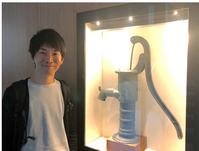
LSHTM（ロンドン大学衛生熱帯医学大学院）にて Pump handleと一緒に

一方で、「研究」のスキルについては、一度腰を据えてしっかりと学びたいという思いも強くなっていき、フェロー終了後は、グローバルヘルスの分野で著名なロンドン大学衛生熱帯医学大学院に留学することにしました。留学中は、大変ではありましたが、日本国内では目にすることのない感染症疾患や、感染症疫学、統計学、公衆衛生学、フィールドでのプロジェクトの実践、感染症疾患のコントロールなどについて多くを学ぶことができ、また世界中から集まった同級生らと貴重な時間を過ごしなが、とても実りの多い留学期間を過ごすことができました。卒業後半年もせずにCOVID-19のパンデミックが起きてしまったわけですが、この際に学んだ事は今、予想以上に役に立っています。