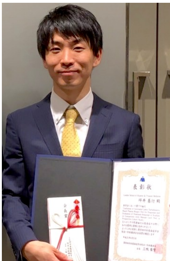
日本感染症学会総会・学術講演会会長賞を受賞

卒後上京して初期研修医となってから、感染症科という診療科と出会い、感染症診療の奥深さに惹かれて感染症医を志すようになりましたが、感染症医は多様な内科疾患全般を診ることができないと勤まらないという先輩医師らの助言もあり、後期研修は内科診療全般を学び直しました。