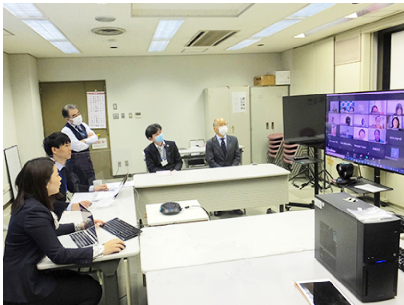
コースリーダーとしてJICA課題別研修 AMR&HCAIを開催・運営

また、その他にも5カ国からの参加者を対象とした薬剤耐性や医療関連感染管理の研修のコースリーダーや、国際保健のオンラインコースの運営、世界保健総会等の国際会議への参加などを行っています。