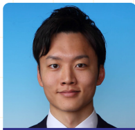
国土交通省 (国家総合職技術職) 採用