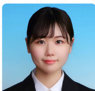
中国経済産業局 (国家一般職) 採用

「なりたい」を叶えられる環境がここにはあります。就職活動や公務員試験が後悔しないものになるよう応援しています!