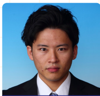
中国財務局 (財務専門官) 採用

将来の選択肢として公務員を考えられている方は受講を検討されることをお勧めします。皆様の進路が納得のいくものとなるよう心から願っています。