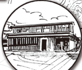
伊勢蔵(味噌・醤油) 9:00~12:30