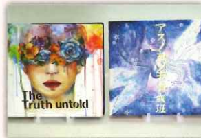
美術 (CD ジャケット)