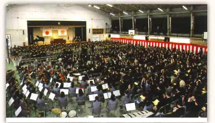
卒業生がオーケストラと式歌「3月9日」を合唱