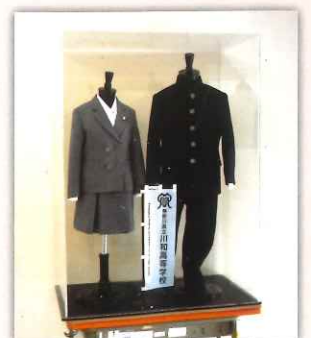
制服 (※女子スラックスもあり)