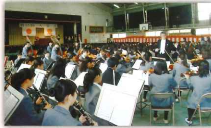
オーケストラの演奏に合わせて新入生入退場