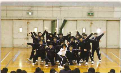
クラスの女子が一致団結