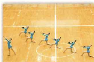
バトントワリング部