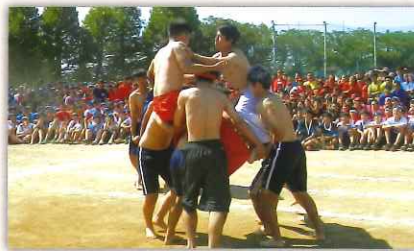
団長同士の騎馬戦