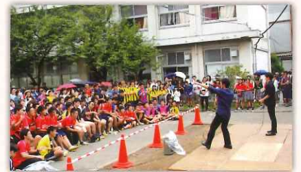
名物は「川和饅頭」。 写真は野外ステージの様子