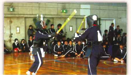
いつもは優しい川和男子もこの日は逞しい「剣士」に変身