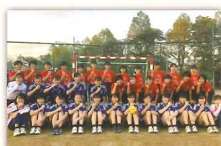
女子ハンドボール部