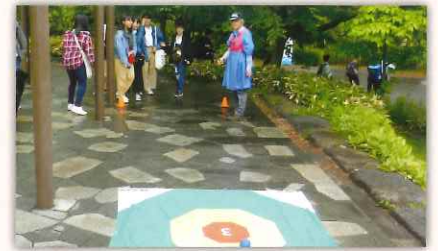
1年生にとっては親睦を深めるいい機会になります