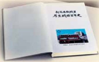
※写真は作成イメージのものです