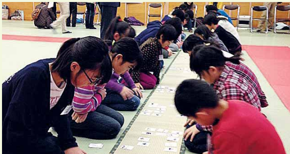
第10回五色百人一首新潟県大会