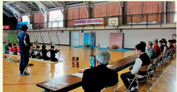
四半的弓道 体験・交流会