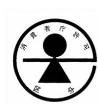
(b) 特別用途食品の標識

以上に述べた(a) 保健機能食品、(a)① 特定保健用食品、(a)② 栄養機能食品、(a)③機能性表示食品、(b) 特別用途食品（特定保健用食品を除く。）、「(a) 特別用途食品」と「(ab) ① 特定保健用食品」と「(b) 特別用途食品」との規制上の関係を図示すると次表のとおりとなる。