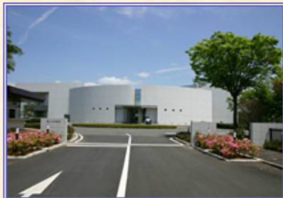
地図と測量の科学館