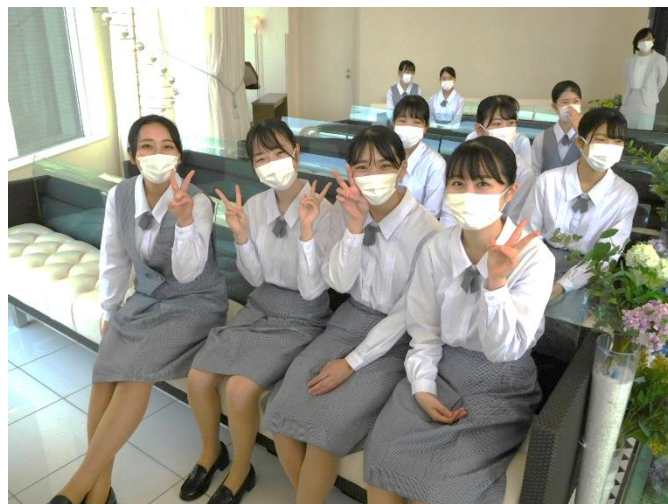
ホテルのチャペルで記念撮影の合間に。