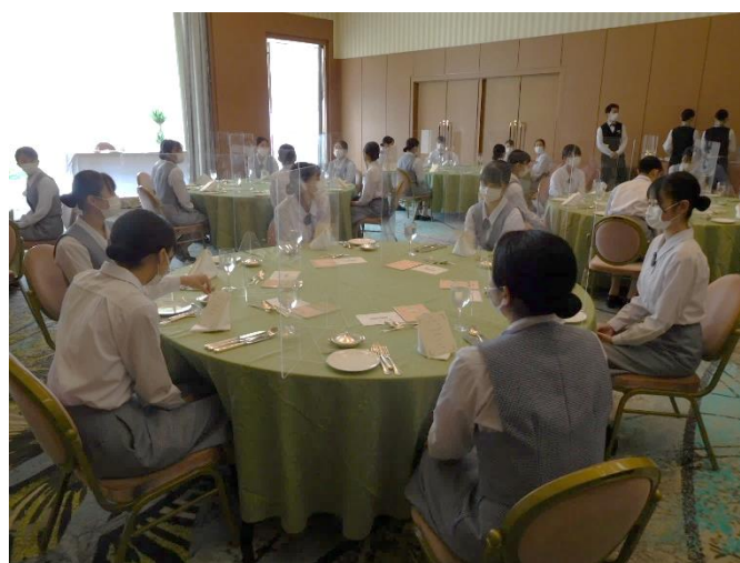
研修② テーブルマナー やや緊張しています。