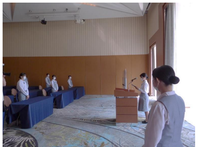
グランドプリンスホテル広島研修会場に到着 開校式を行いました。