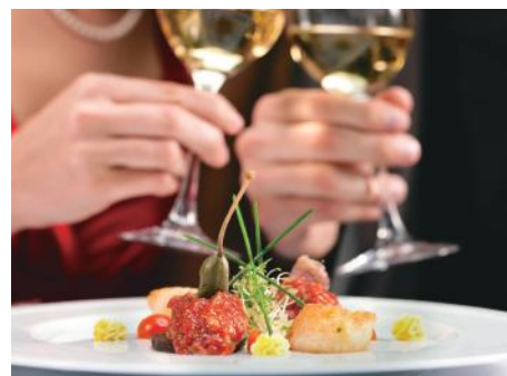
B賞 帝国ホテル東京 ディナーギフト券2万円分