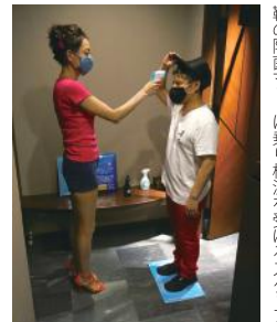
靴の除菌マットに乗り検温を受けるスタッフ

2018 年 7 月に「笹木」をオープン。高級感がありながらアットホームな雰囲気クラブとして、コロナショックまでは順調に営業を続けていました。