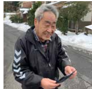
稲葉山地区自治会長 新さん

昨年7月からスマートフォンによる通報投稿システム「みつけたろう」の運用を始めました。みつけたろうでは、町内会長などが、道路の陥没や遊具の破損などの不具合情報をシステムに投稿すると、市が写真と位置情報から状況を把握して対策を行います。従来の電話やメールでの方法と比べ、迅速な対応につながっています。