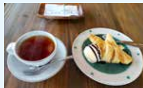
いなば西郷工芸の郷 ギャラリー&カフェ okudan ドリンク&デザート

西郷工芸の郷に、念願の地域の工房の作品を一堂に見られるギャラリーとカフェが、昨年12月にオープン! 月替わりのデザートとドリンクのセットを地域が誇る工芸品とともにご堪能ください。 ※毎週水・土・日曜日 10時~16時まで営業 ※4月1日~29日まで休業(予定)