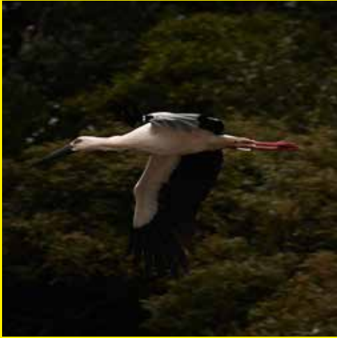
@keiichi0626 さん「幸運の出会い」

国の特別天然記念物「コウノトリ」の飛翔姿をばっちりとらえた1枚ですね！見かけた際はできるだけ離れて見守ってください。