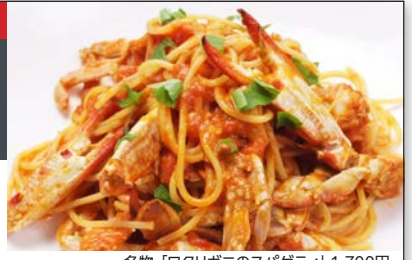
名物「タブリアニのスパゲティ」1,700円

☎ 076-262-8087 〒 金沢木倉町 5-1 ☎ 12:00~LO14:00、17:00~LO22:30 ☎ 不定休 ☎ バス停片町から徒歩 3分