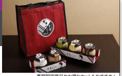
季節限定商品やお得なセットもおすすめ!

☎ 076-225-7749 〒 金沢市東山 1-13-10 ☎ 10:00 ~ 17:00 ☎ 火曜 ☎ バス橋場町から徒歩 4分