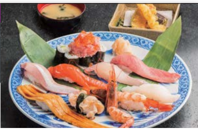
人気のデカねた漁師寿し上10貫

☎ 076-255-1066 〒 金沢市西念 4-14-8 ☎ 平日 11:00 ~ 14:30 (LO 14:00) 土日祝 ~ 15:00 (LO14:30) 17:00 ~ 21:30 (LO21:00) ☎ 水曜 日曜営業 ☎ JR 金沢駅金沢港口 (西口) 車10分