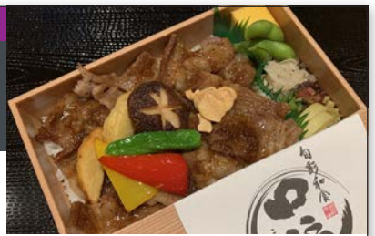
地元ブランド牛「能登牛」を秘伝のたれで味わう!

☎ 076-225-8080 〒 金沢市青草町 88 (近江町いちば館 2F) ☎ 11:00 ~ 15:00、 17:00 ~ 22:00 (L.O.21:00) ☎ 火曜 (祝日は営業) ☎ 近江町市場バス停から徒歩 1分