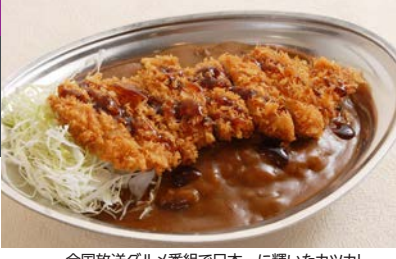
全国放送グルメ番組で日本一に輝いたカツカレー

☎ 076-234-0634 〒 金沢市武蔵町 15-1 (金沢エムザ B1F) ☎ 11:00~21:00 (LO20:30) ☎ 無休 日曜営業 ☎ 近江町市場バス停から徒歩2分