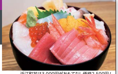
近江町丼は3,000円がおもてなし価格2,500円!

https://www.instagram.com/sushi_enome/?hl=ja