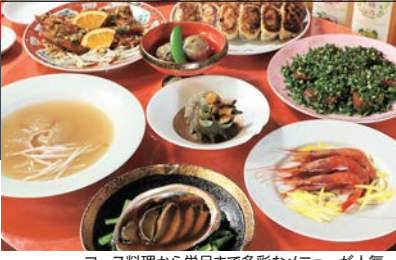
コース料理から単品まで多彩なメニューが人気

☎ 076-222-4262 〒 金沢市柿木畠 5-7 ☎ 11:30~14:00 18:00~23:00 (LO 22:30) ☎ 月曜 日曜営業 ☎ バス停香林坊から徒歩 5分