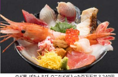
のど黒、ぼたんえび、ウニなどが入った百万石丼 3,240円

☎ 076-208-3571 〒 金沢市下堤町 38-1 ☎ 8:00 ~ 21:00 (水曜 15 時まで) ☎ 不定休 日曜営業 ☎ 近江町市場内