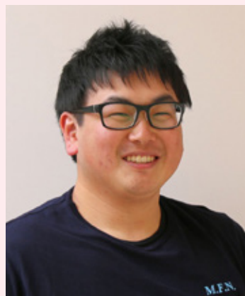
第5学年 文化連絡協議会委員長 中国語会話部 松濤祭・体育祭実行委員会

先輩・後輩の学年を越えたつながりというのは一生モノだと思います。部活動を通して、共に6年間のキャンパスライフを充実させていきましょう!!