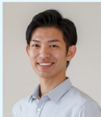
第3学年 体育連絡協議会委員長 第34回松濤祭実行委員長 自動車部 松濤祭・体育祭実行委員会

この大学の一員として、新しい仲間と一緒に大学生活を楽しんで過ごし、大学を盛り上げるよう一緒に頑張っていきましょう。体育連絡協議会を代表して、歓迎の挨拶とさせていただきます。