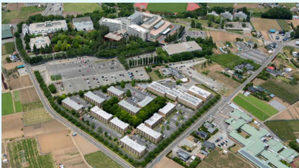
町野 惇 Atsushi Machino