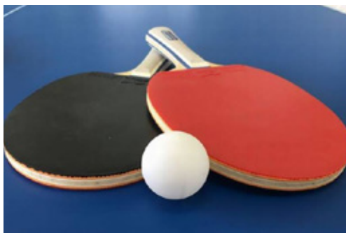
Table Tennis Circle