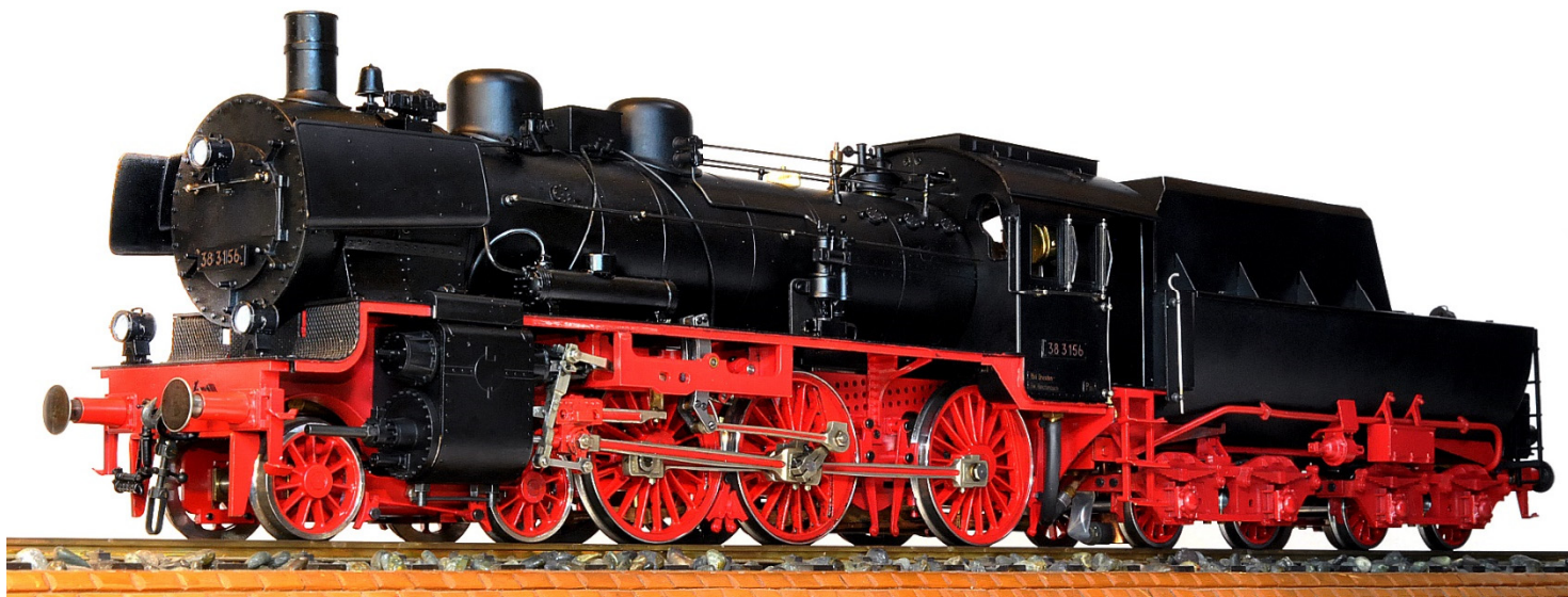
KPEV P8 仕様

展示モデルだったので完成品にしたものが残っているのです。まあ、弊社的には、気長に売れば？という商品ですが、宜しければ、ご検討ください。BR38 は DB 仕様の新品で 58 万ですが。P8 はレストア品なので 38 万でご提供します (税送料別です) 下のワンネンテンダーは別売品です