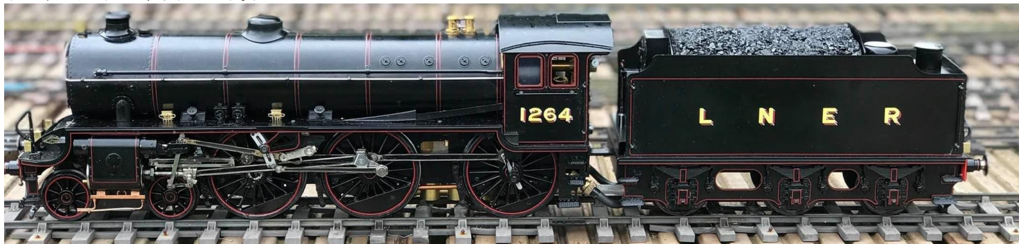
下がオリジナルの B1

BR の黒が 330,000 円 (税送料別) ですから、黒い仕様が欲しければ、こちらだと思うのですが、一応 1 週間受け付けます。くどいようですが B1 のプロトタイプとしたモデルは下のモデルです。しかし、コレクターの方には、このバリエーション日本では 1 台も販売していませんことは、事実です、あ！それとボイラーの煙管数は、5 本ではなく 2 本の仕様になるかもしれません。その場合は予めご了承ください。(まあバナーの芯を少し長めにすれば、パフォーマンスは変わらないと思います。燃費は落ちると思いますが、まあ誤差の範囲でしょう。)