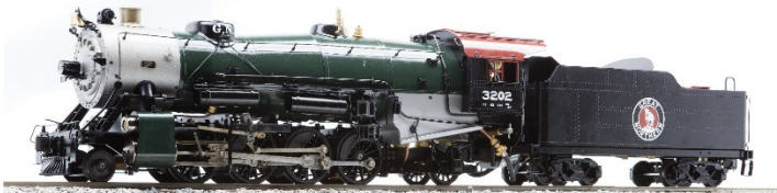
グレートノーザン鉄道仕様