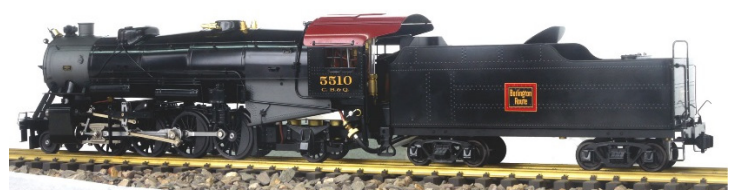
パーリントンルート仕様