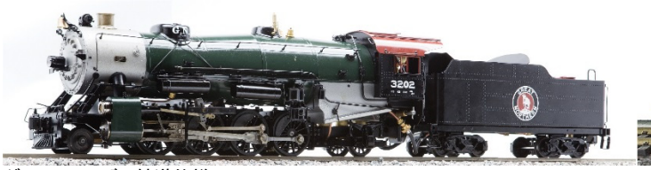
グレートノーザン鉄道仕様