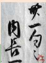
橋本家文書 個人蔵

ふるさとミュージアム山城 (京都府立山城郷土資料館 Kyoto Prefectural Yamashiro Regional Museum)